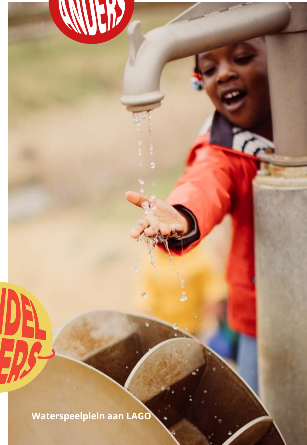
Waterspeelplein aan LAGO

Je walk on watar zit erop. Tijd voor een ontspannende duik in zwembad LAGO Kortrijk Weide. Als je meer zin hebt in droog blijven met een drankje, zoek je een plekje op het terras van Rest-eau-café met zicht op de waterspeeltuin. Daar pompen je kinderen water op en leiden ze het doorheen kanaaltjes tot in de modderbakkerij of een andere ingenieuze zand-water-modderconstructie.