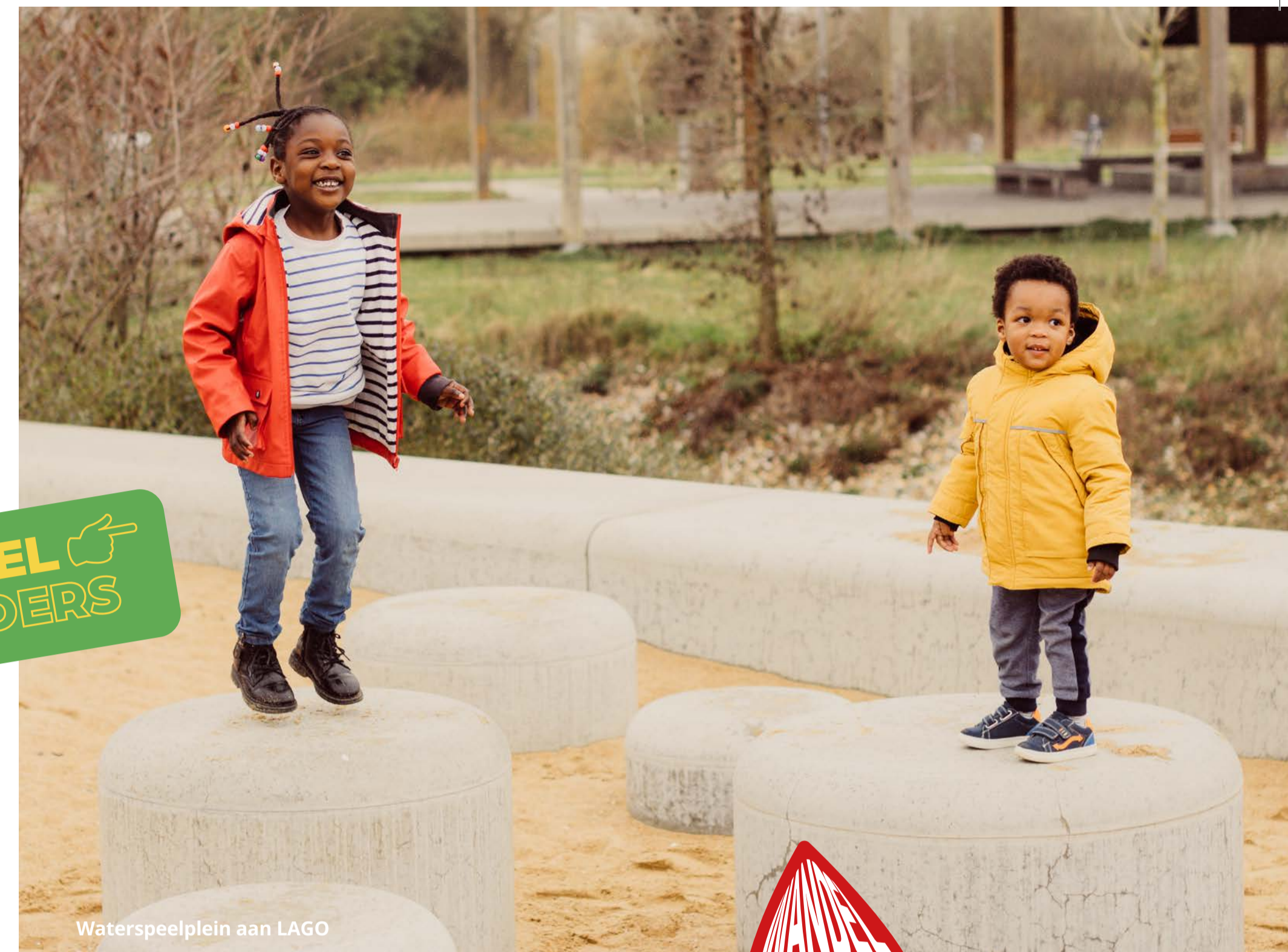
Waterspeelplein aan LAGO

De opvallende glaspartijen in het appartement dat je passeert, zijn een verwijzing naar de golfjes op het Leiewater vlakbij. Het gebouw heet – voor de hand liggend – Waterspiegel.